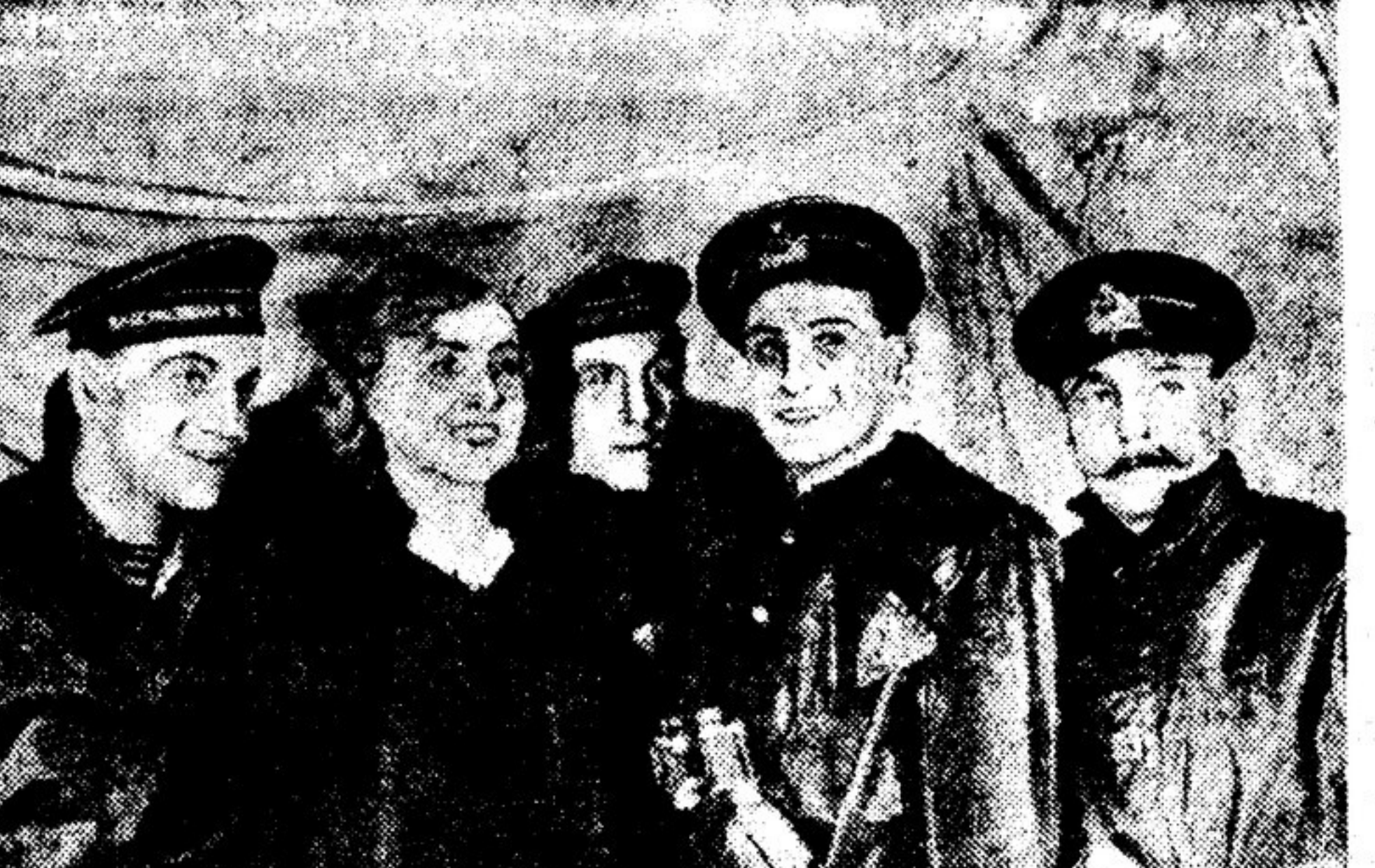
В Московском Камерном театре состоялась премьера героической музыкальной комедии «Отелло»...