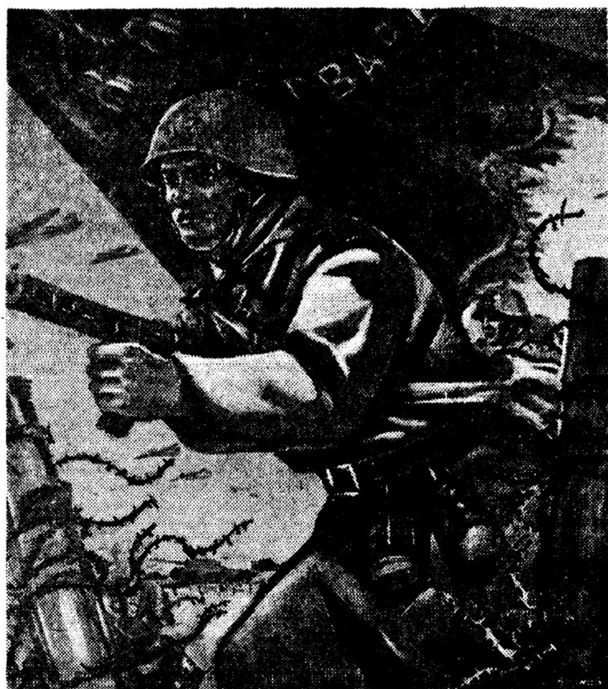
Воины Красной Армии, победа близка! Писатель А. БУТОВО. Издательство «Искусство», 1941 г.

Фронт и тыл в нашей стране — понятия неразделимые. Победа над ненавистным врагом добывается в пущих Полесья и на западах Урала, в шахтах восстановленного Донбасса и в степях правобережной Украины.